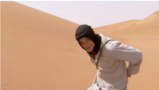
サハラ砂漠で生き残る方法 (8月20日公開)