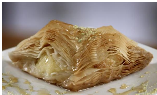
バクラヴァの大量生産 (8月21日公開予定)