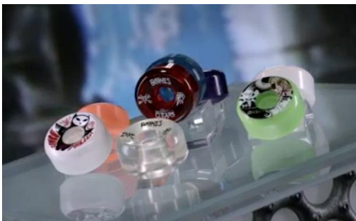
スケートボード用ウィールができるまで (8月20日公開)