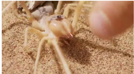
砂漠でクモを食べる男 (8月21日公開予定)