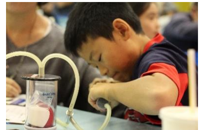
過去の宇宙科学イベントの様子

ディスカバリー・ジャパン株式会社（東京都千代田区、代表取締役社長：デービット・マクドナルド）は、未来に活躍する子どもたちに届ける宇宙の研究室「ディスカバリーキッズ コズミックラボ」を今年9月から10月にかけて全国5都市で開催することを決定し、本日7月11日（木）より特設サイト（ https://www.discoverychannel.jp/campaign/cosmiclab2019/ ）にて、参加応募受付を開始します。