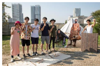
サバイバル・マスター！