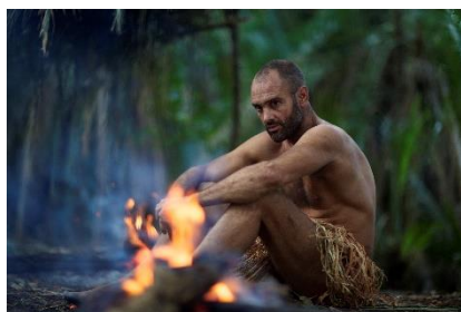
ザ・秘境生活シーズン1