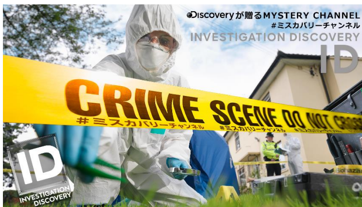
ID YouTube チャンネル メイン画像