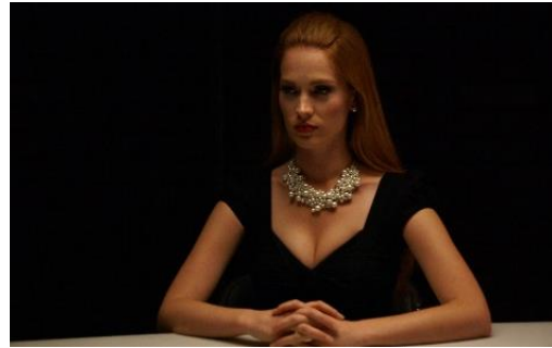
「ミスコン女性殺人」