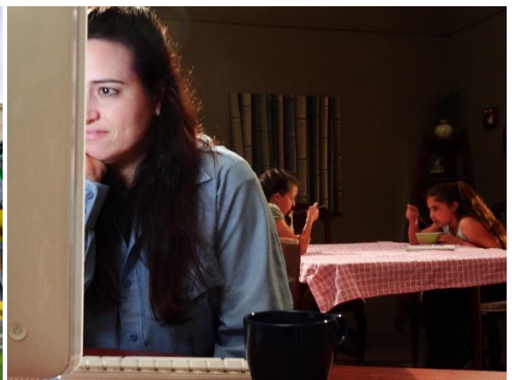
「犯罪の心理学」より

ディスカバリー・ジャパン株式会社（東京都千代田区、代表取締役社長：デービット・マクドナルド）は、ディスカバリーがグローバルで展開する女性向けミステリー専門チャンネル「Investigation Discovery (ID)、読み：インベスティゲーションディスカバリー（略してアイディ）、以下 ID」の日本版公式 YouTube チャンネルを 11 月 22 日（金）より開設し、刺激的なミステリーコンテンツを順次公開します。