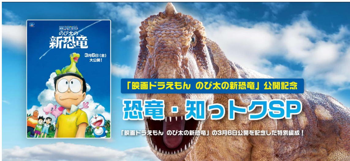
「恐竜・知っトク SP」特設ウェブサイト イメージ画像

ディスカバリー・ジャパン株式会社（東京都千代田区、代表取締役社長：デービット・マクドナルド）が展開する世界最大級の動物チャンネル「アニマルプラネット」では、ドラえもん50周年記念作品「映画ドラえもん のび太の新恐竜」の2020年3月6日（金）からの劇場公開を記念して、2月29日（土）より特別編成「恐竜・知っトクSP」を放送します。また、株式会社ジュピターテレコム（J:COM）と共同で制作したオリジナル番組「映画ドラえもん と恐竜の世界」を2月29日（土）よりJ:COMオンデマンド（※）で独占先行配信、アニマルプラネットでは3月1日（日）に放送を開始します。※視聴には「J:COM TV」へのご加入が必要です。さらに、2月15日（土）～3月31日（火）の期間中、抽選で50名様に「映画ドラえもん のび太の新恐竜」のぬいぐるみと恐竜柄の今治タオルセットが当たるキャンペーンも実施します。