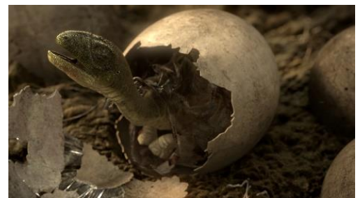
「BBC 超大作 プラネット・ダイナソー」