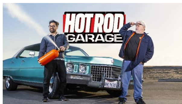
「ホットロッド・ガレージ シーズン1」（PREMIUMで視聴可能）