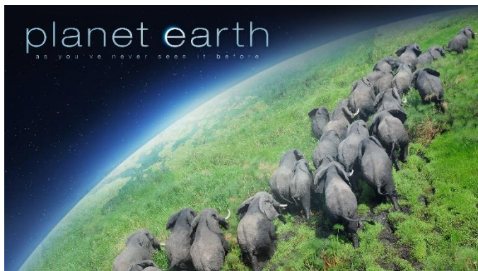
「プラネット・アース シーズン1」 (PREMIUMプランで視聴可能)

BBC や MotorTrend の日本未上陸番組を含め、合計 3,000 エピソード以上にコンテンツ拡充