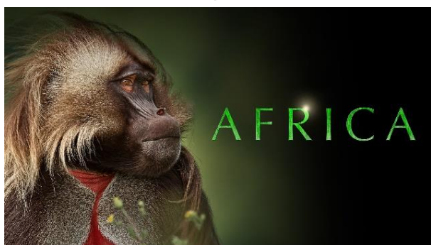
「アフリカ」（PREMIUMで視聴可能）