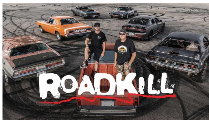
「ロードキル シーズン1」 (PREMIUMプランで視聴可能)

ディスカバリー・ジャパン株式会社 (東京都千代田区、代表取締役社長：デービット・マクドナルド) は、ディスカバリーがグローバルで展開している動画配信サービス「Dplay (読み：ディープレイ)」 ( https://dplay.jp/ ) において、2020年3月16日 (月) より新たに有料プランを開始し、SVOD (Subscription Video On Demand: サブスクリプションビデオオンデマンド、定額制動画配信) サービスを展開したことを発表します。