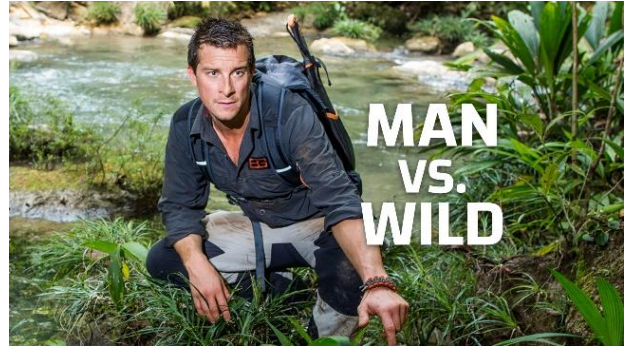
「サバイバルゲーム」

https://www.dplay.jp/show/marooned-with-ed-stafford