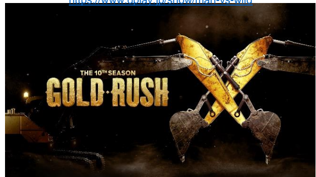
「ゴールド・ラッシュ～人生最後の一攫千金～」

https://www.dplay.jp/show/wheeler-dealers