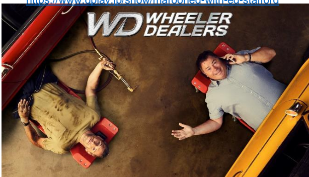
「名車再生！クラシックカー・ディーラーズ」

https://www.dplay.jp/show/wheeler-dealers